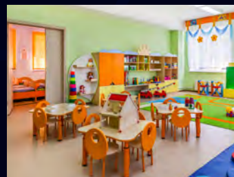
児童施設・学校・図書館