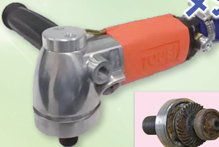
ウォーターサンダーWS-6