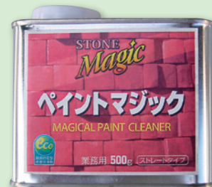
ペイントマジック

工場内の作業中コンクリート床に、接着・補修などで使用している接着剤(AKEMIマープルフィラー、TENAXなど)が不意にこぼれて、そのまま床に染みになって困ってしまったことはありませんか？ 実はその染みは、ペイントマジックで簡単に除去できます。