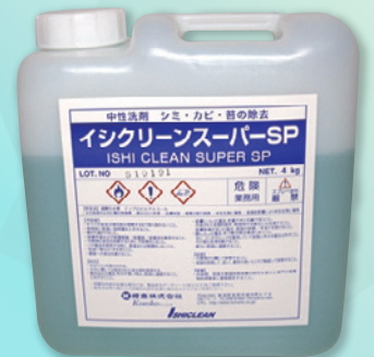
イシクリーンスーパーSP