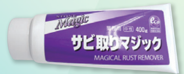
サビ取りマジック

シミであると判断できましたので、中性洗剤「イシクリーンスーパーSP」をティッシュにしみこませて患部に貼り付ける湿布工法にて対応しました(ネンドルがあればネンドルをご利用ください)。この湿布工法で注意することは、貼り付けている薬剤がしみ込んだティッシュを乾かない様にラップすることです。湿布したまま放置すること24時間後、ティッシュを剥がして水洗浄してみると、綺麗にシミを吸い上げ、除去することが出来ました。