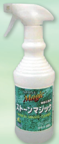
ストーンマジック

現場での作業ですので、環境に優しいストーンマジックを選択しました。汚れが染み込んだJB仕上げ面にストーンマジックをスプレーし、30秒後にデッキブラシにて洗浄しました。その後は水道水で洗い流し(成分が有機酸のため洗浄污水をそのまま下水に流しても問題ありません)、作業を2回ほど繰り返すときれいに除去することが出来ました。(写真②) 本磨き部分も傷めることなく本来の輝きを取り戻すほど綺麗になり、施主様には大変喜ばれました。G623のJB面やサンダー面には、ストーンマジックが抜群の除去力があると再確認できました。