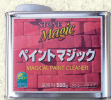
ペイントマジック