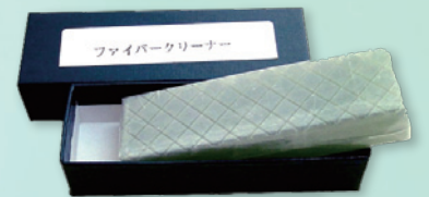
ファイバークリーナー