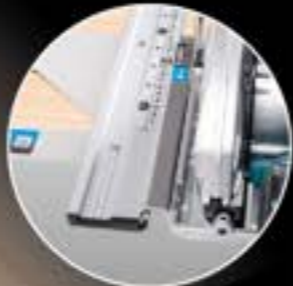
スライダー溝付 (73236 スライダーは別売です)