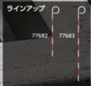
画像はイメージです。