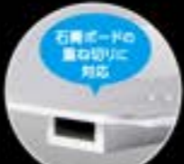
石青ボードの 裏面切りに 対応