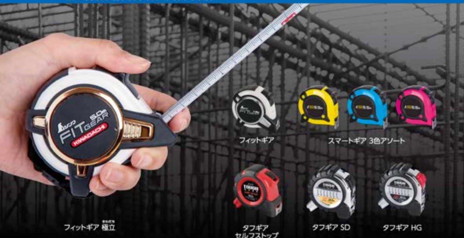
フィットギア 極立