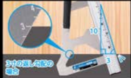
3寸の緩し勾配の 場合