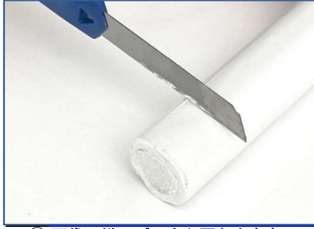
② 画像の様にパテを必要な大きさに カッターで輪切りにします。