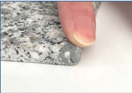
④ キズの部分に、よく練ったパテを 少量ずつこすりつけるようにして 埋めて盛っていきます。 自然乾燥で15~20分、急ぐ時は ドライヤーにて乾燥させます。