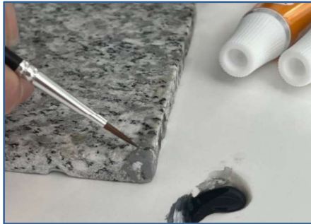
⑤ パテ硬化後、余分な部分をサンド ペーパーを使用して研磨します。 エナメルペイントをシンナーで希釈し 必要な箇所を着色していきます。 ※着色の際は、市販のパレット等 をご使用ください。