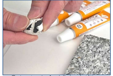
③ カットしたパテを指先で色が均一に なるまで練ります。 また、パテ(白)にシンナーで希釈 したエナメルペイントを加えて 混ぜ合わせる事で着色ができます。 ※目安 パテ幅約2cm、約5滴 ※パテ同士を混ぜ合わせ調色可能