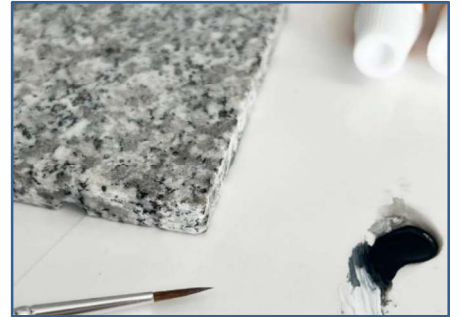
⑥ 着色剤が完全に乾燥したら、 完成です。