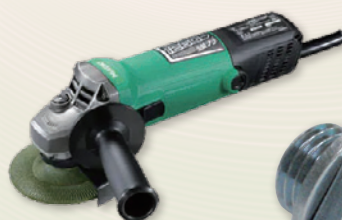
変則可能な電子グラインダー

また、平面やC面の研磨には、硬い素材のマジックパッドを使用しますと、波打つことなく平面を美しく仕上げることが可能です。