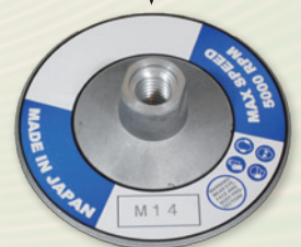
硬い素材のマジックパッド