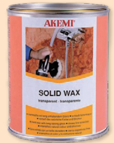
AKEMI ソリッドワックス

これからも石のある暮らしを守り続けていきたいものです・life with STONE