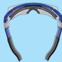
① フレーム幅が変わる

コンパクト設計でフィット性能が高い保護メガネを紹介します。フレーム幅・テンプル(こめかみ)角度の調整が自由にできるトリプルファンクションフレーム採用により装着時のフィット感が抜群です。男性から女性まで幅広くフィットするため様々な現場にてご使用いただけます。防傷&防曇加工のPET-AFレンズ採用により安全で快適な視界も確保できます。当然オーバーグラス設計によりメガネの上からでも装着可能です。