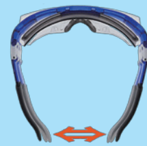
② フレックスフレーム

フレックスフレームシステム採用。フレーム部のみが動くので高い防護性能をキープしジャストフィットします。