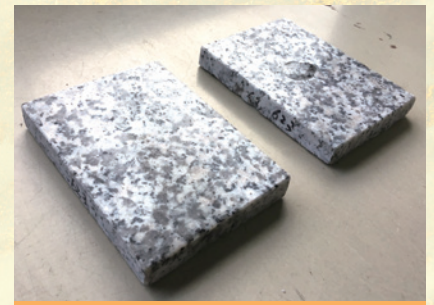
塗布1時間後 左側:溶剤系 右側:水性系