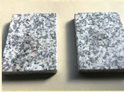
塗布30分後 左側:溶剤系 右側:水性系

水性系の保護剤は、一度塗布しますと表面に膜を生成しますので、再塗布が出来ません。除去剤もありませんので、塗布時にはムラにならないように十分にご注意ください。