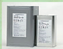
クリアコート(建築)